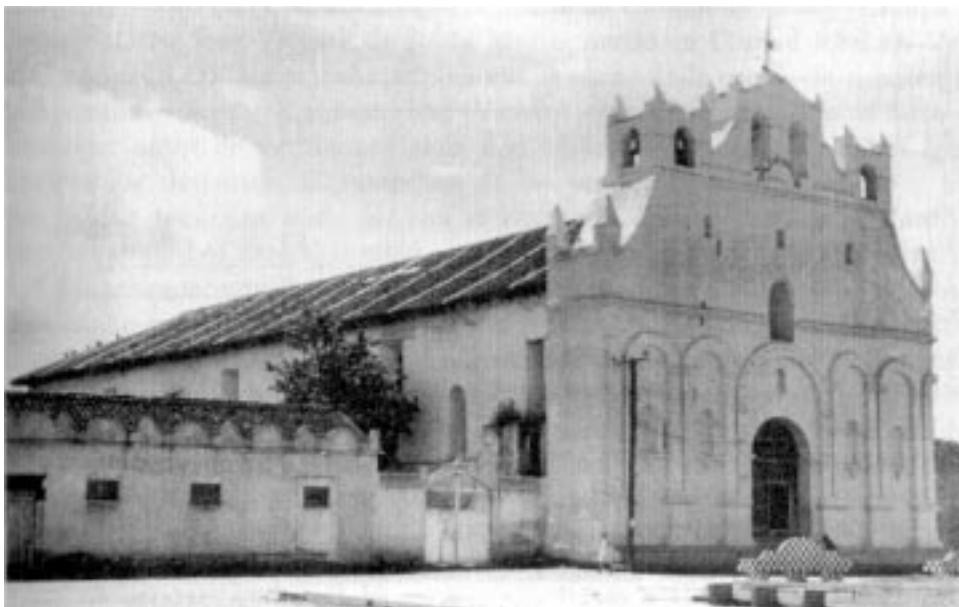
Fachada principal de una iglesia en Teopisca, Chiapas Mesoamérica 20 (diciembre de 1990)