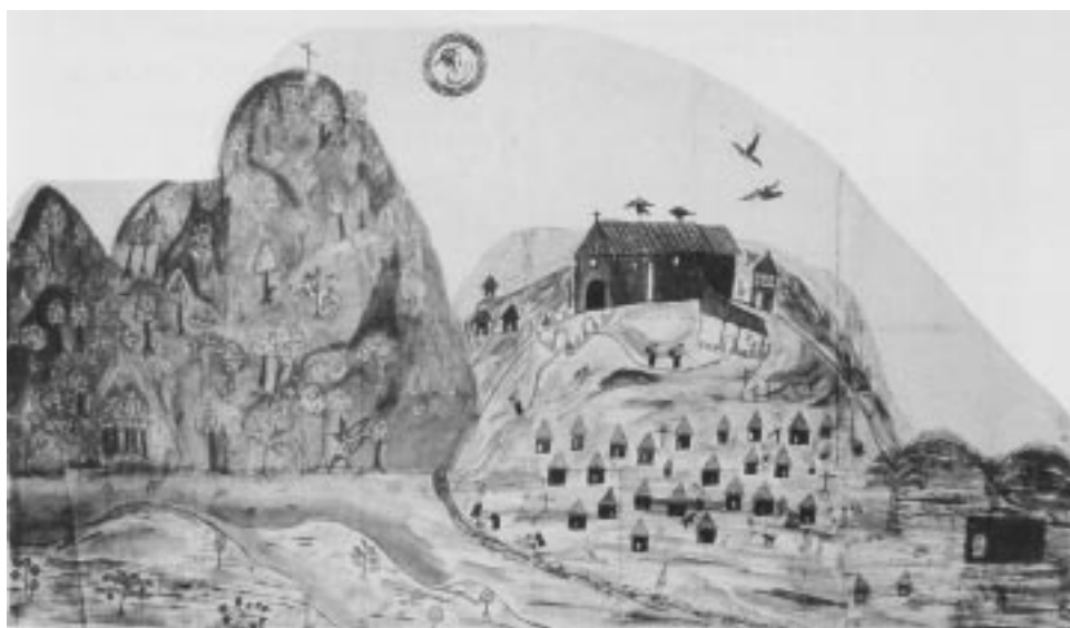
Acuarela del Santuario de Tila, Chiapas Ilustración de portada, Mesoamérica 49 (2007)