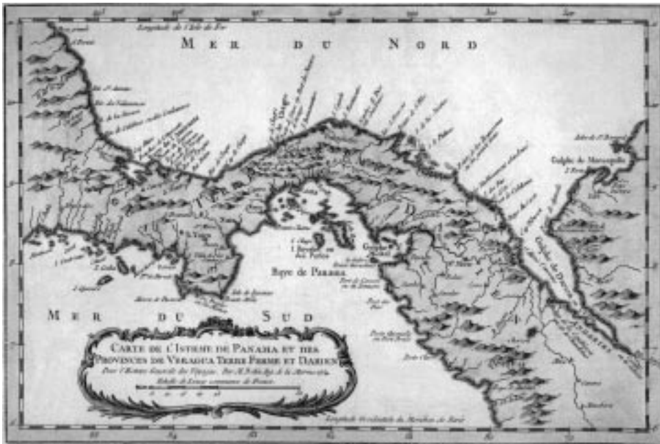
Carte de l'Isthme de Panama et des Provinces de Veragua Ilustración de portada, Mesoamérica 45 (2003)